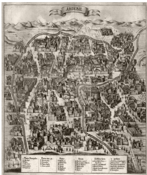
شکل ۲- اردبیل صفوی (۱۶۳۷م) ترسیم دستی از آدام اولناریوس مأخذ: اولناریوس ۱۱۷۷ش-۱۰۷۸ش، شاه محمد اردبیلی، ۱۳۹۵