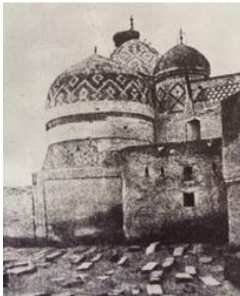
شکل ۳- بقعه شیخ صفی‌الدین ۱۸۹۷