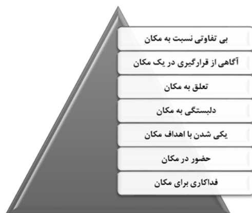
شکل ۱- نمودار سطوح هفتگانه حس مکان از نظر شامای

بنابر گفته رلف، دو سطح اولیه مورد اشاره شامای عمدتاً سطوح ادراکی و شناختی فرد نسبت به محیط را شامل می‌شود، از سطح ۳ به بعد، ابعاد احساسی فرد نسبت به مکان را شامل می‌شود به طوری که رلف نیز بر عمیق‌ترین سطح وابستگی به مکان به صورت ناخودآگاه اشاره می‌نماید و اعلام می‌کند ناآگاهانه بودن حس تعلق زمانی خود را نشان می‌دهد که فقدان یا جدایی فرد و مکان اتفاق بیافتد و حس تعلق دارای طیف وسیعی از بی‌مکانی تا تعلق و هم‌ذات‌پنداری شدید با مکان است (Relph, 1976).