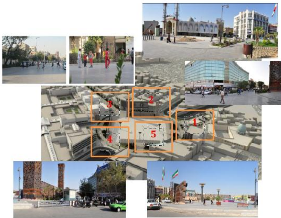
شکل ۳ - نقشه مفهومی مقایسه وضعیت تنوع فعالیت‌ها و فعالیت‌های دارای جاذبه در دو مکان مورد مطالعه