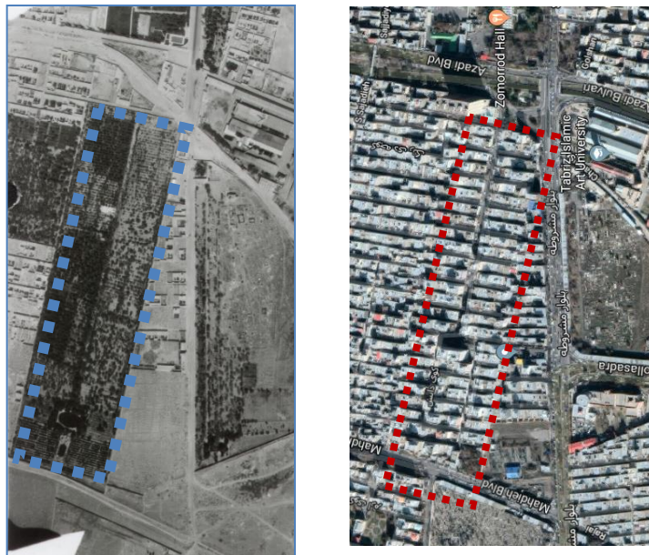
شکل ۱- سمت راست: موقعیت کوی دانش در سال ۱۳۹۷، سمت چپ: موقعیت زمین خالی در سال ۱۳۴۶ قبل از اختصاص یافتن به کوی دانش