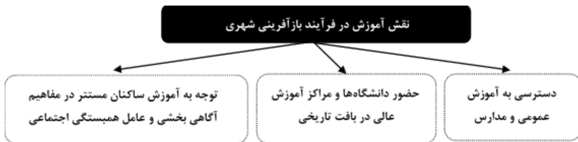
شکل ۱. دیدگاه‌های موجود درباب نقش آموزش در فرآیند بازآفرینی شهری

توجه به مقوله آموزش از سه دیدگاه استقرار واحدهای آموزش عالی، دسترسی به آموزش عمومی و اجرای آموزش‌های همگانی برای جلب مشارکت مردمی، در فرآیند بازآفرینی شهری تبیین گردیده‌است.