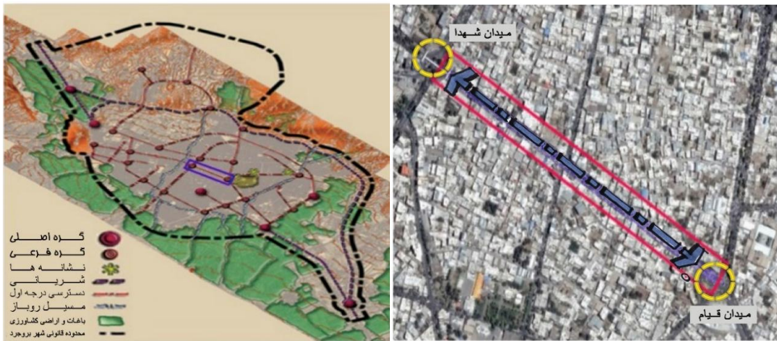
شکل ۲. موقعیت محدوده مورد مطالعه در شهر بروجرد

شهر بروجرد، از نظر تقسیمات سیاسی متعلق به استان لرستان در غرب کشور است. وسعت محدوده قانونی شهر بالغ بر ۳۷۱۹ هکتار بوده که به سه منطقه شهرداری و ۱۷ ناحیه که شامل ۳۶ محله می‌باشد تقسیم شده است. بر اساس سرشماری سال ۱۳۹۵ شهر بروجرد دارای ۳۲۶۴۵۲ نفر جمعیت، ۱۰۲۲۵۸ خانوار و بعد خانوار ۳،۱۹ می‌باشد. محدوده مورد مطالعه، بلوار شهدا (حد فاصل میدان قیام تا میدان شهدا) به طول ۸۰۰ متر می‌باشد که در امتداد شمال غرب- جنوب شرق کشیده شده است. محور یاد شده از نظر تقسیمات کالبدی در محدوده منطقه یک شهر قرار دارد. شیب توپوگرافی محور از شمال به جنوب است. کارکرد اصلی آن در هماهنگی با محورهای اطراف کارکرد تجاری- گردشگری است و با توجه به دو طرفه بودن بلوار شهدا، در برقراری ارتباط و ایجاد هم‌پیوندی میان دو گره اصلی شهر یعنی میدان شهدا و میدان قیام نقش مهمی ایفاء می‌کند. شکل دو، محدوده مورد مطالعه را نمایش می‌دهد.