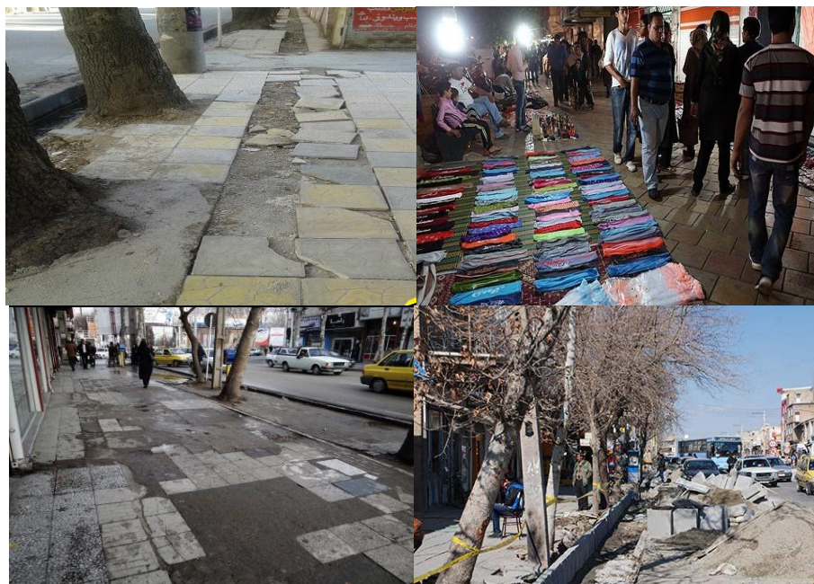
شکل ۳. برخی از مشکلات و چالش‌های موجود در مسیرهای پیاده

بر اساس نظریات مطرح در زمینه اهمیت پیاده‌روها و ضوابط مربوط به ایجاد، بهسازی و مناسب‌سازی آن‌ها و همچنین آسیب‌شناسی انجام پذیرفته توسط نگارندگان، چالش‌ها و موانع از سه جنبه (قبل از اجرا، هنگام اجرا و پس از اجرا) مورد توجه قرار گرفته است. عوامل چالش‌زا یا مؤلفه‌های تأثیرگذار بر بهسازی و مناسب‌سازی محور پیاده در ۳۱ مورد بر حسب هر یک از چالش‌های سه مرحله، تنظیم و از هم تفکیک شده‌اند که در جدول دو، نمایش داده شده است.