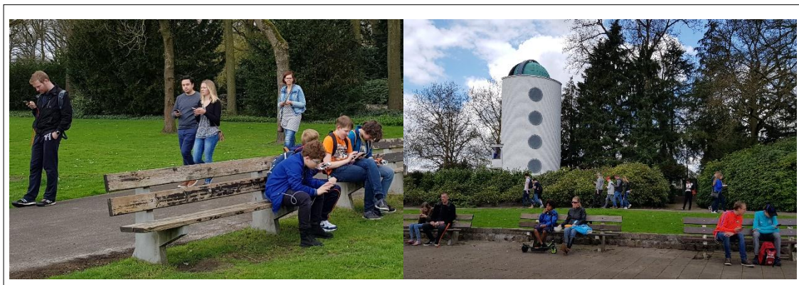
شکل ۳. فضای شهر صحنه‌ی بازی پوکمون‌گو- پارک استادسوندل، آیندهون، هلند

فضاهای شهری در طول تاریخ، اصلی‌ترین فضاها برای دیدن و دیده شدن بوده‌اند، صحنه‌هایی برای نمایش‌های کوچک و بزرگ که امکان برون رفت از روزمرگی را فراهم می‌کنند. با عملکرد فناوری‌ها به عنوان واسطه ارتباط با مکان، شاهد کم‌رنگ شدن و حتی به تعبیری از بین رفتن مرزهای میان بازیگر و تماشاگر هستیم. این نبود مرز میان نقش‌های مختلفی که شهروندان در فضاهای شهری به خود می‌گیرند نیز مشهود است. در فضای شهری هیبریدی مرز مشخصی نه تنها میان تماشاگر-بازیگر، بلکه میان خریدار-فروشنده، خدمات دهنده-خدمات گیرنده نیز وجود ندارد و این‌ها در هر لحظه در حال تبدیل شدن به یکدیگر بوده و شهروندان قادر به ایفای چندین نقش به شکل هم‌زمان هستند. دو فضایی شدن موجب شده است لایه‌های عملکردی گوناگون بر روی یکدیگر قرار بگیرند و محدودیت‌های رایج در انجام فعالیت‌ها از میان برداشته شود. تنوع فعالیت‌ها و آزادی عمل مکان‌های شبکه‌ای قدرت انتخاب فعالیت‌های گوناگون را در اختیار می‌دهد.