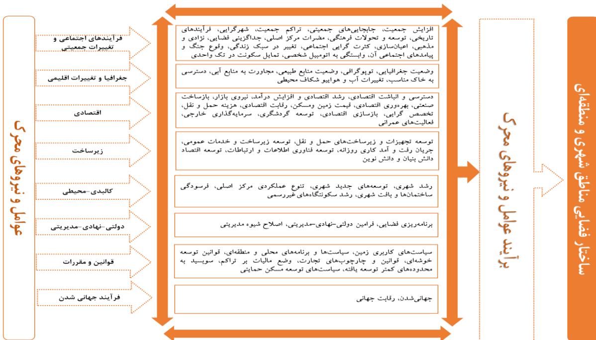
شکل ۲. عوامل و نیروهای محرک موثر بر ساختار فضایی شهری و منطقه‌ای