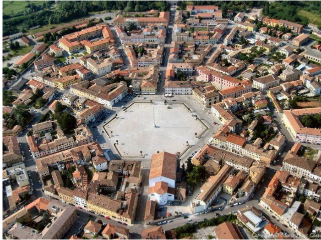
شکل ۱. شهر باستانی پالمانوا فضای کالبدی شهر نشان از درهم تنیدگی فضای عمومی و خصوصی است که انسان می تواند تمام اجزای شهر را با حواس ۵ گانه خود حس کند.