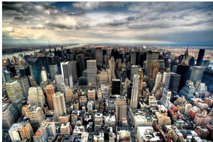
شکل ۴. کلانشهر نیویورک از گره‌ها و شریان‌های آمد و شد سریع است. شهری با پراکندگی بسیار کم مرکز و پیرامون در آن بی‌معنی شده است. در این شهر فرهنگ غالبی وجود ندارد. نیویورک شهری با دگرگونی‌های چشمگیر فنی است که به سرعت در حال طی کردن سیر شبکه‌ای شدن است.

«در سه دههٔ آخرین قرن بیستم، مفهوم کلان‌شهر در حیطهٔ دگرگونی‌های چشمگیر فنی در وسایل و شبکه‌های حمل‌ونقل، بخصوص ریلی، جاده‌ای، و هوایی و نیز شبکه‌های ارتباطی دگرگون می‌شود. شهری که این زیست‌جهان‌های متفاوت را به وسیلهٔ شبکه‌های جاده‌ای و ریلی سریع‌السیر و شبکه‌های ارتباطات از راه دور به هم می‌دوزد. مکان‌هایی با نقش‌های دوگانهٔ واقعی و مجازی که در آن‌ها مفاهیم زمان، مکان، و فاصله دگرپرسی یافته‌اند. عبور از کلان‌شهر (متروپل) به ورانشهر (متاپول ۲ ) در حال وقوع است. در متاپول جهان‌های موازی در کنار هم قرار گرفته‌اند و با یکدیگر ارتباط برقرار می‌کنند. منطقه‌های از نظر عملکردی پیوسته و از نظر اجتماعی ناپیوسته، متمرکز و نامتمرکز، گسسته ولی متعامل با پیراشهرهای در هم آمیخته است و روابط چهره به چهره و رودررو اهمیتی دوچندان می‌یابند» (حبیبی، ۱۳۹۴).