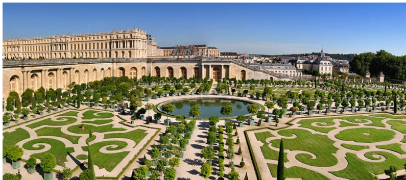
شکل ۲. نمایی از کاخ ورسای که خود را در معرض نمایش شهروند قرار می دهد. در این مجموعه شهری به تناسبات انسان توجه شده است.