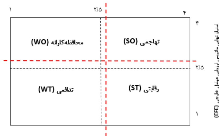
شکل ۳. ماتریس تحلیل عوامل داخلی و خارجی (IE)

با توجه به اینکه جمع نمرات نهایی ماتریس EFE، ۲/۶۲۲ و جمع نمرات نهایی ماتریس IFE، ۲/۵۶ است و همان‌طور که در ماتریس IE (شکل شماره ۴) نشان داده شده است، استراتژی تهاجمی (SO) استراتژی برتر است. این دسته از استراتژی‌ها از تلاقی نقاط قوت (S) از محیط داخلی با فرصت‌ها (O) از محیط خارجی تولید می‌شود و هدف از تولید آن‌ها، به حداکثر رساندن توانمندی‌های سیستم است.