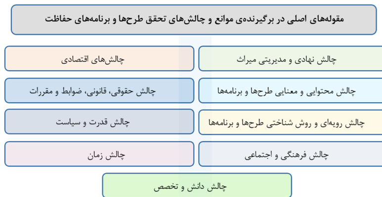
شکل ۲. مقوله‌های اصلی دربرگیرنده‌ی موانع و چالش‌های تحقق طرح‌ها و برنامه‌های حفاظت

کدگذاری محوری در مورد یافتن روابط بین مقوله‌ها و زیرمجموعه‌های آن‌ها است (ولف‌سوئینکل و همکاران، ۲۰۱۳). از این‌رو کلیه‌ی مفاهیم استخراج‌شده از مقالات در قالب ۹ مقوله‌ی اصلی خلاصه و دسته‌بندی گردید که هر یک از این مقوله‌ها گویای شاخه و زمینه‌ای از موانع و چالش‌های برنامه‌ریزی حفاظت و توسعه و علل عدم تحقق آن‌ها است (نمودار ۱).