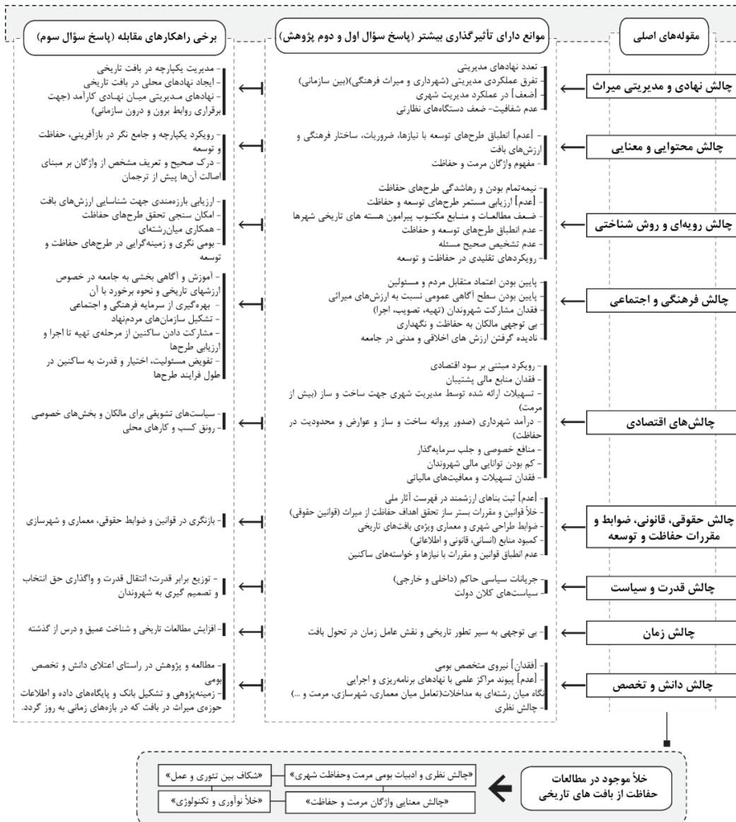
شکل ۳. جمع‌بندی مهم‌ترین موانع و چالش‌های طرح‌های حفاظت و توسعه در ایران