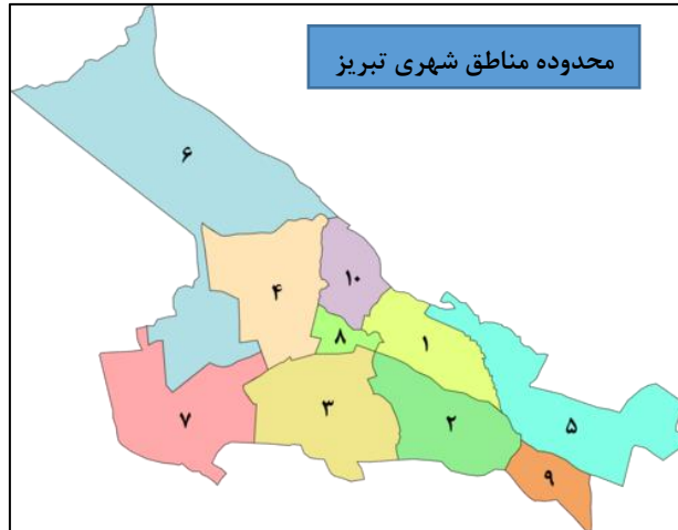
شکل ۲. نقشه مناطق شهری محدوده مورد مطالعه در شهر تبریز