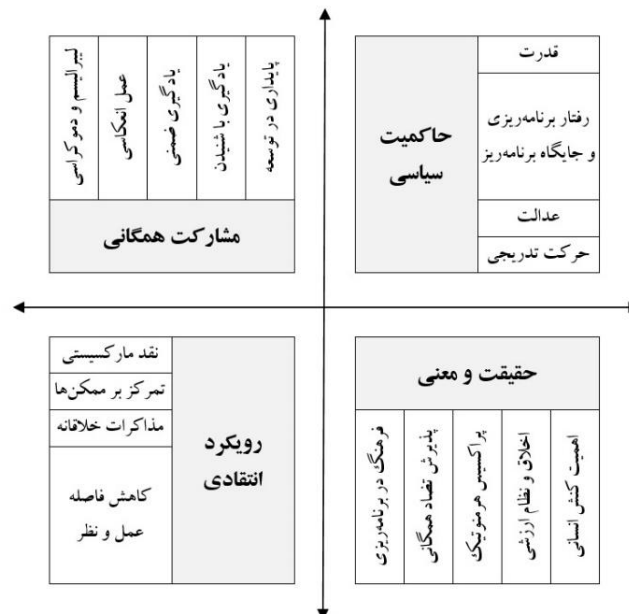
شکل ۱. طبقه‌بندی مفاهیم پرتکرار در برنامه‌ریزی شهری عمل‌گرا (پراگماتیستی)

پژوهش حاضر مبتنی بر پارادایم فلسفی پراگماتیسم و در چارچوب روش کیفی صورت‌بندی شده است؛ روش کیفی اساساً در جستجوی «مفاهیم» است (Mohajan, 2018). بر این اساس مرور منابع و پیشینه پژوهش با رویکرد جستجوی مفاهیم، در بین 25 اثر پژوهشی که مشخصاً ارتباط میان شهرداری و فلسفه پراگماتیسم را محور کار خود قرار داده‌اند، انجام شده است. مفاهیم شناسایی شده شامل: قدرت (Hoch, 1984-a)، لیبرالیسم و دموکراسی (Talissee & Aikin, 2008)، رویکرد انتقادی و نقد مارکسیستی (Bridge, 2014 & Forester, 2017 & Forester, 2012)، اخلاق و نظام ارزشی جامعه (Furlong et al., 2017)، بازساخت امور ممکن ۲ به‌جای تمرکز بر ناممکن‌ها (Holden & Scerri, 2015)، حرکت تدریجی (Hoch, 2017)، پذیرش تضاد عمومی (Meck, 1991)، انعطاف‌پذیری و پیشروی بر اساس بازخوردهای دریافتی یا «عمل تأملی- انعکاسی» ۳ (Schön, 1982)، آموزش و یادگیری ضمنی (Schön, 2017)، یادگیری با شنیدن ۴ (Jon, 2020)، پراکسیس هرمنوتیک ۵ (اثر متقابل فهم و کنش) یا کاربرد عملی اصول هرمنوتیک در تفسیر و فهم پدیده‌ها (Verma, 1996)، عدالت و مقابله با تبعیض (Hoch, 2016 & Dorstewitz, 2008)، مذاکرات خلاقانه ۶ در برنامه‌ریزی شهری (Forester, 2013)، جایگاه فرهنگ در عمل برنامه‌ریزی (هیلی، ۲۰۰۹)، رفتار برنامه‌ریزی (Hall, 2014)، پایداری توسعه (Batty, 2006)، اهمیت کنش انسانی (Hoch, 2007) و پرکردن فاصله میان عمل و نظر (Hoch, 1984-b) که مجموع این ۱۸ مفهوم در ۴ دسته: «حاکمیت سیاسی»، «رویکرد انتقادی»، «جستجوی حقیقت و معنا» و «مشارکت» مطابق نمودار زیر و برای کاربرد در ادامه پژوهش گروه‌بندی شده‌اند.